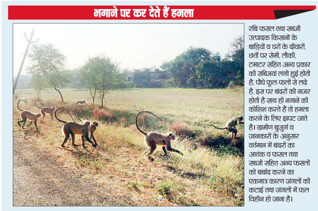
राहत नहीं मिल रही है। साथ ही साथ खेतों तथा बाड़ियों में काम करने वाले पुरुष व महिलाओं में दहशत व्याप्त है।

शहर सहित ग्रामीण क्षेत्रों में इन दिनों किसानों के खेतों में रबि फसल चना, तिवरा, गेहूँ व मसूर की फसल परिपक्व होकर तैयार हो चुके हैं। वहीं क्षेत्र में बंदरों के आतंक से किसानों की परिपक्व हुई फसल चना, गेहूँ व तिवरा तथा मसूर फसलों को भारी नुकसान पहुंचा रहे हैं। ग्रामीणों से मिली जानकारी के अनुसार क्षेत्र में झुंड के झुंड बंदर के आतंक ने किसानों के खेतों पर परिपक्व फसलों को नुकसान पहुंचा रहे हैं साथ ही साथ सफाचट कर रहे हैं, जिसे लेकर ग्रामीण किसानों को भारी नुकसानों का सामना व चिंता का विषय बना हुआ है। जिससे ग्रामीण किसान बंदरों के आतंक से परेशान है। प्राप्त जानकारी के अनुसार सब्जी की खेती कर रहे किसान इन दिनों बंदरों के आतंक से परेशान व चिंतित हैं, जिससे क्षेत्र के ग्राम बरबसपुर, दौजरी, रामपुर कला, चंडालपुर, नाऊडीह व जरती के किसानों का कहना है कि बंदरों का झुंड एक साथ आकर रबि फसल व सब्जी की खेती को पूरी तरह बर्बाद कर देते हैं, इससे साल भर की मेहनत पर पानी फिर रहा है, वहीं ग्रामीण किसानों द्वारा कई उपाय कर रहे हैं, लेकिन