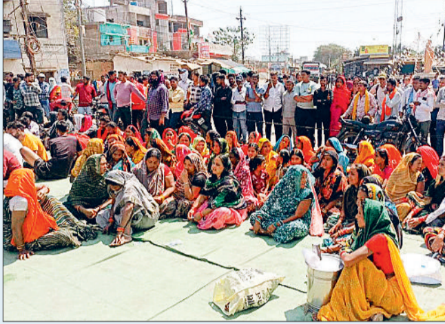
भी कई बड़े हादसे हो चुके हैं और कई लोगों की जान भी जा चुकी है। लेकिन लगातार की मांग के बाद भी शासन-प्रशासन द्वारा इस शराब दुकान को यहां से नहीं हटाया जा रहा है।

क्षेत्र के लोगों का आरोप है कि मिनीमाता चौक और नवीन पुलिस लाइन के बीच नेशनल हाइवे में संचालित शराब दुकान लगातार दुर्घटनाओं का कारण बन रही है। उन्होंने बताया कि यहां शराब दुकान संचालित होने के कारण सुबह से लेकर देररात तक लोगों और वाहनों की भारी भीड़ रहती है। जिसके चलते आए दिन छोटे बड़े हादसे होते ही रहते हैं। लोगों ने बताया कि इससे पूर्व ही इस क्षेत्र में पहले