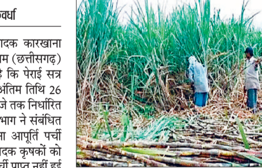
संपर्क करके गन्ना आपूर्ति पच्ची प्राप्त करने की सलाह दी गई है। भोरमदेव शक्कर कारखाना के

भोरमदेव सहकारी शक्कर उत्पादक कारखाना मर्यादित, कवर्धा, जिला कबीरधाम (छत्तीसगढ़) द्वारा यह सूचना जारी की गई है कि पेराई सत्र 2024-25 में गन्ना खरीदी की अंतिम तिथि 26 फरवरी 2025 को रात्रि 12:00 बजे तक निर्धारित की गई है। कारखाने के गन्ना विभाग ने संबंधित गन्ना उत्पादक कृषकों को गन्ना आपूर्ति पच्ची प्रदान कर दी है। जिन गन्ना उत्पादक कृषकों को किसी कारणवश गन्ना आपूर्ति पच्ची प्राप्त नहीं हुई है, उन्हें तुरंत भोरमदेव सहकारी शक्कर कारखाना कवर्धा के गन्ना विभाग या अपने क्षेत्रवाक्य से